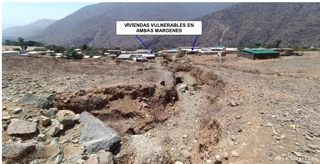
FIGURA N°01: TRAMO CRÍTICO EN LA QUEBRADA YUNGUI, EN EL SECTOR YUNGUI, DISTRITO DE IHUARI, PROVINCIA DE HUARAL - LIMA.