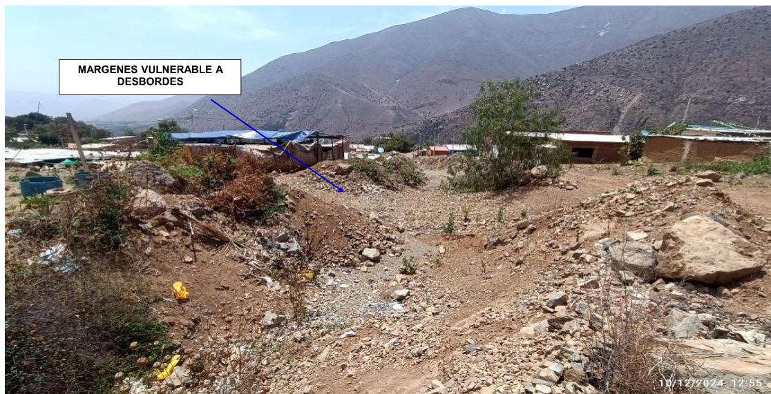
FIGURA N°02: VIVIENDAS DE DIFERENTES MATERIALES UBICADOS EN AMBAS MARGENES DE LA QUEBRADA YUNGUI