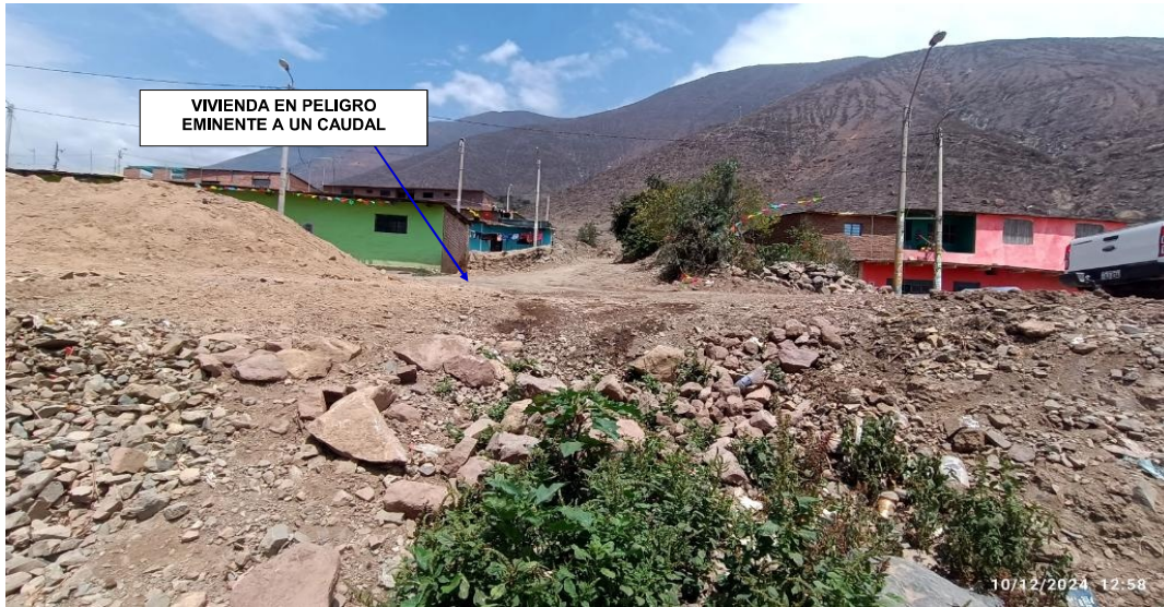
FIGURA N°04: EN LA TEMPORADA DE MAXIMAS AVENIDAS, LA QUEBRADA YUNGUI ESTA PROPENSO A LOS DESBORDES HACIA LAS VIVIENDAS EN AMBAS MARGENES.