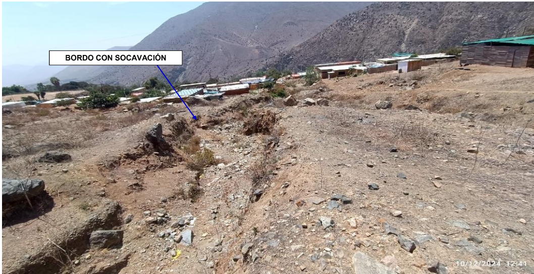
FIGURA N°03: QUEBRADA YUNGUI CON BORDOS EROSIONADOS, PRESENTANDO PELIGRO EMINENTE A DESBORDES